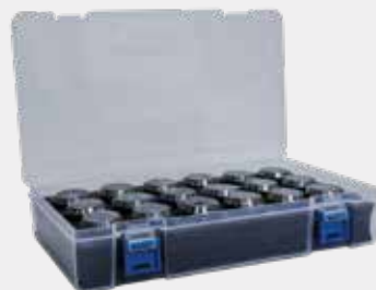
Kit de Pinças