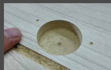
Caneco de Dobradiça