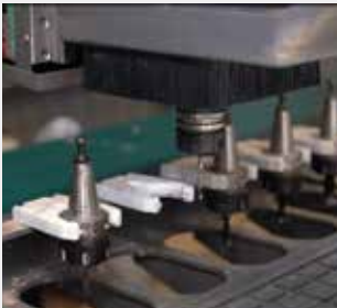
Troca Automática de 12 Ferramentas