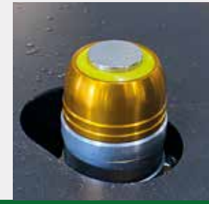
Probe de Zeramento