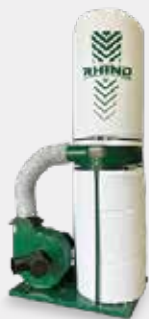
Coletor de Pó