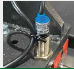
Sensor de Fim de Curso