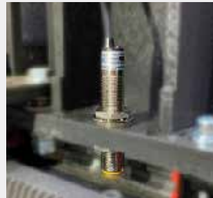
Sensor de Home