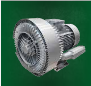
Bomba de Vácuo