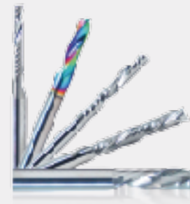
Jogo de Fresas